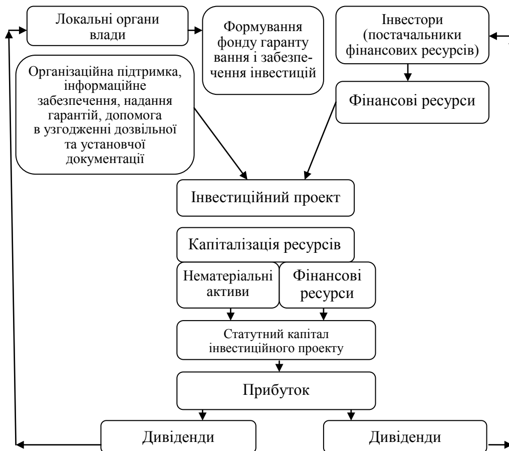
Рис. 2. Схема державно-приватного партнерства за методом участі в капіталі

Фінансові ресурси залучаються від представників бізнесу, а організаційно-інформаційне супроводження і підтримку проекту здійснюють органи місцевої влади, представники місцевого самоврядування. При цьому організаційна робота і забезпечення органів місцевої влади повинні мати конкретне фінансове вираження, тобто проходити процес оцінювання, капіталізації, перетворюватись на нематеріальний актив і формувати частку статутного капіталу інвестиційного проекту. Виникає схема забезпечення фінансами і нематеріальними активами у вигляді забезпечення і супроводження проекту, причому кожна зі складових капіталізується і формує статутний капітал інвестиційного проекту, учасники якого мають права на дивіденди від прибутку, отриманого в ході реалізації проекту.