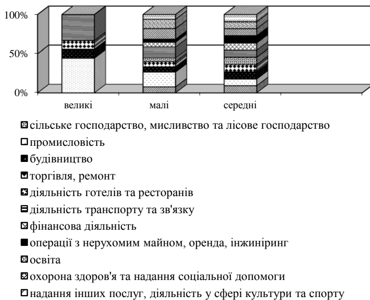
Рис. 3. Кількість підприємств за розмірами та видами економічної діяльності у 2012 р., %