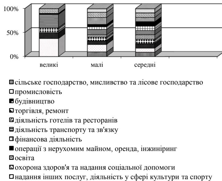
Рис. 2. Кількість підприємств за розмірами та видами економічної діяльності у 2011 р., %