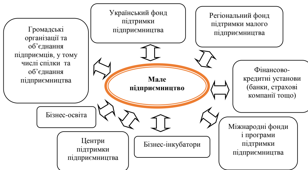
Рис. 4. Інфраструктура МП

найбільш поширеним видом якого є бізнес-інкубатор, який допомагає успішному розвитку початківців у бізнесі, надаючи їм технічну та консультативну допомогу протягом першого, найбільш важкого року діяльності.