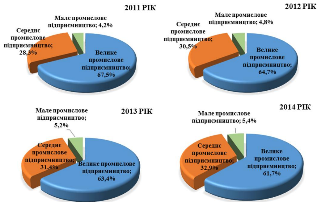
Рис.2. Діаграми обсягу реалізованої продукції (товарів, послуг) промислових підприємств за їх розмірами 2011-2014 рр. [8]

На основі даних таблиці 1 побудовано діаграми на рис. 2.