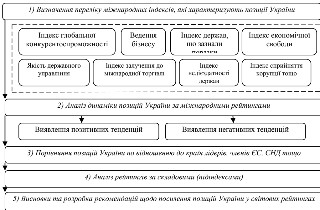
Рис. 4. Оцінка результатів реалізації політики дерегулювання економіки у світових рейтингах

Послідовність даного етапу аналізу наведено на рис. 4.