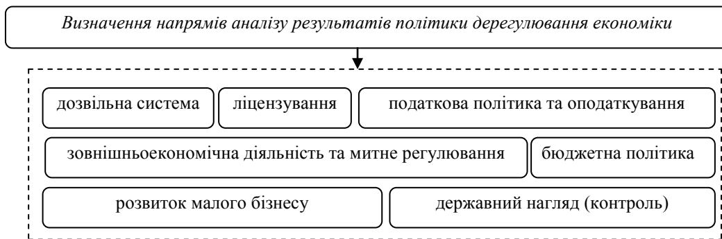
Рис. 2. Основні напрямки аналізу результатів політики дерегулювання економіки

соціально-економічних умовах може сприяти як функціонуванню ринкової економіки з точки зору підвищення її економічної ефективності, так і практичної реалізації соціальної орієнтації ринково-економічної системи [6]. Послідовність аналізу нормативно-правових актів у сфері дерегулювання економіки слід представити наступним чином (рис. 3).