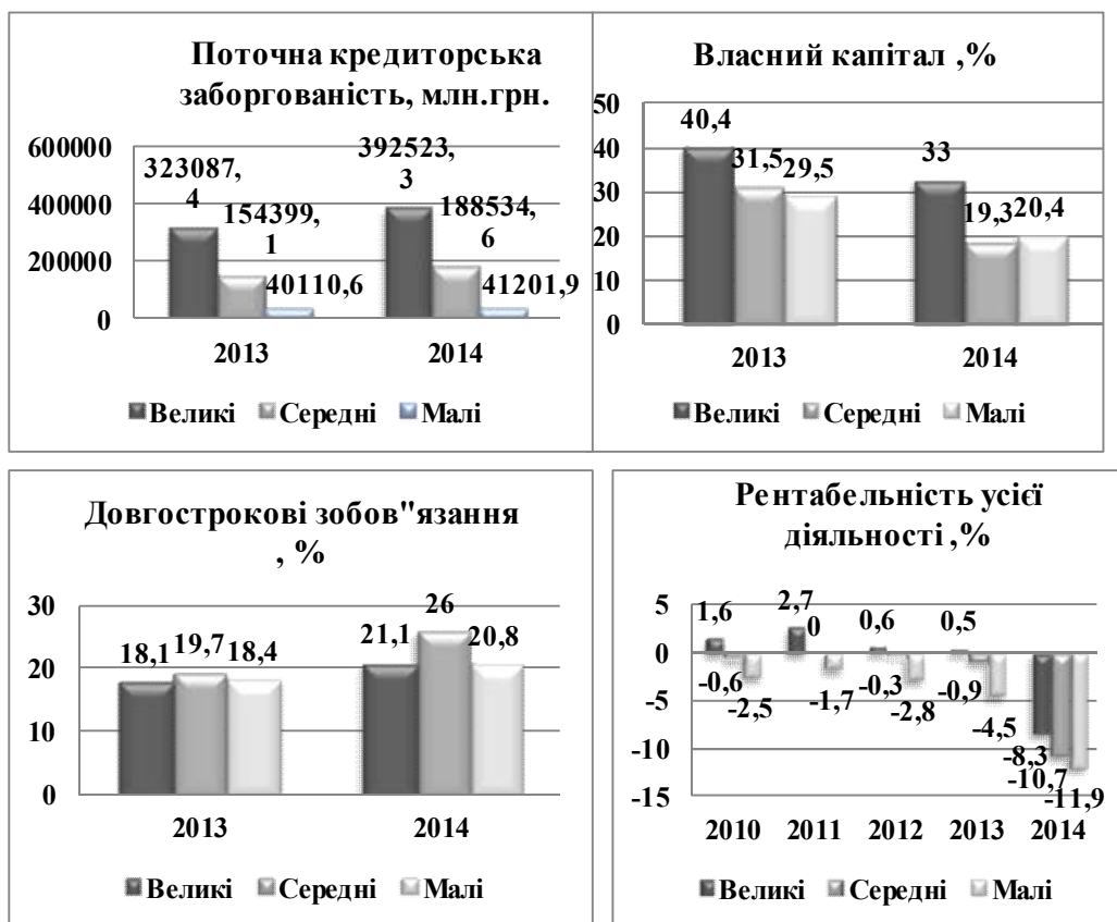
Рис. 3. Деякі показники фінансового стану підприємств за розмірами [7]

Нову українську державну політику відносно розвитку підприємництва пропонується будувати на підставі певної неоліберальної моделі, що припускає максимальне звільнення від державного втручання, як у процеси регулювання, так і в процеси формування й фінансування інфраструктури підтримки бізнесу. Внаслідок цього, державна система підтримки розвитку малого підприємництва, яка формувалася в Україні на протязі майже 13 років, фактично деінституціоналізована. У 2014-2016 рр. урядом не виконуються закони України «Про Національну програму сприяння розвитку підприємництва в Україні»; «Про розвиток і державну підтримку малого і середнього підприємництва в Україні»; ряд постанов Кабінету міністрів України, що стосуються надання кредитно-гарантійної підтримки малого бізнесу, не розробляються й не фінансуються програми мікрокредитування бізнесу й підтримки інноваційного бізнесу, не фінансуються дослідження стану розвитку підприємництва на національному і регіональному рівнях, у секторальному й галузевому вимірі й відповідні публікації щорічних звітів. Не існує інформації щодо функціонування мережі об'єктів інфраструктури підтримки МСП у регіонах, яку на протязі 1996-2013 рр. було створено як інституційну основу для реалізації державної політики у сфері розвитку та підтримки підприємництва.