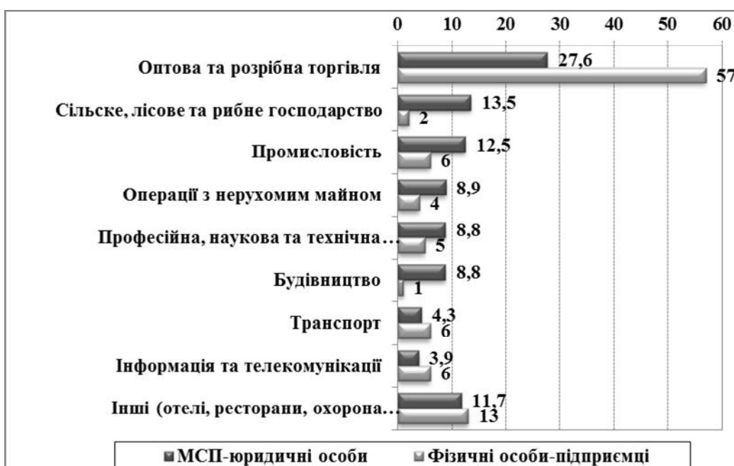
Рис. 2. Топ-9 галузей для МСП-юридичних осіб та ФОП, % від зареєстрованих [7,8].

невиплати ПДВ, втрати коштів, що були розміщені на депозитах 80 збанкрутілих банків, зниження заощаджень населення (майже на 1 млрд. дол. США в 2014 р.), зменшення валютних грошових переказів, підвищення вартості життя, збільшення рівня бідності і різке зниження споживчого попиту. Усе це негативно впливає на темпи розвитку малих та середніх підприємств тому, що головним джерелом інвестицій (72,2%) [10] вітчизняних підприємств залишаються власні кошти.