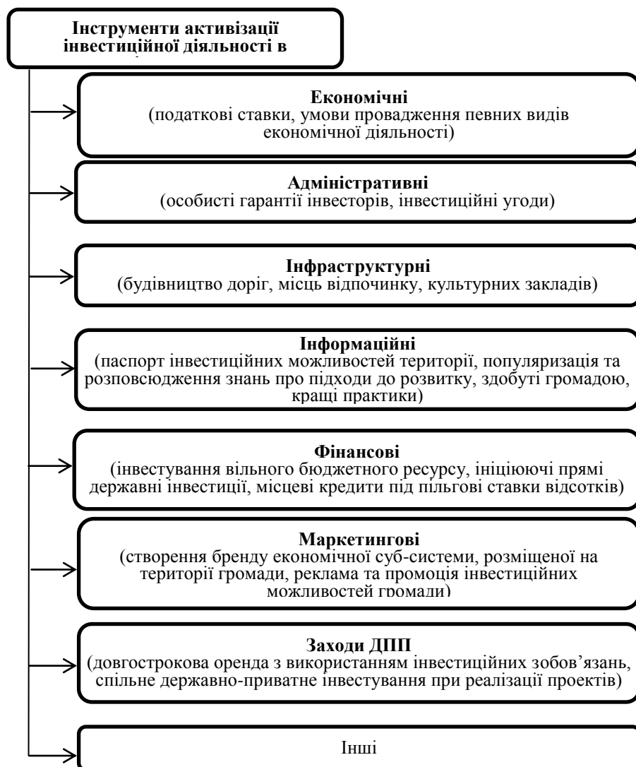
Рис.2. Інструменти активізації інвестиційної діяльності в територіальних громадах

Формування сприятливого інвестиційного клімату для забезпечення активізації соціально-економічного розвитку національної системи господарювання та регіонів є стратегічним завданням для держави з огляду на постійну потребу в фінансових ресурсах, підсилена наслідками світової фінансової кризи, та з огляду на практичну відсутність інституціонального іноземного інвестування і якісно суттєвих капіталовкладень, які б спрямовувались на модернізацію економічної системи.