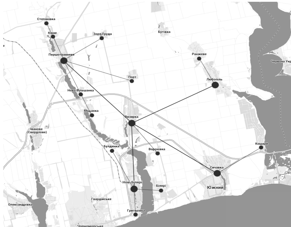
Рис. 1 Визирська об'єднана територіальна громада (Актуальний варіант об'єднання станом на жовтень 2017 року)