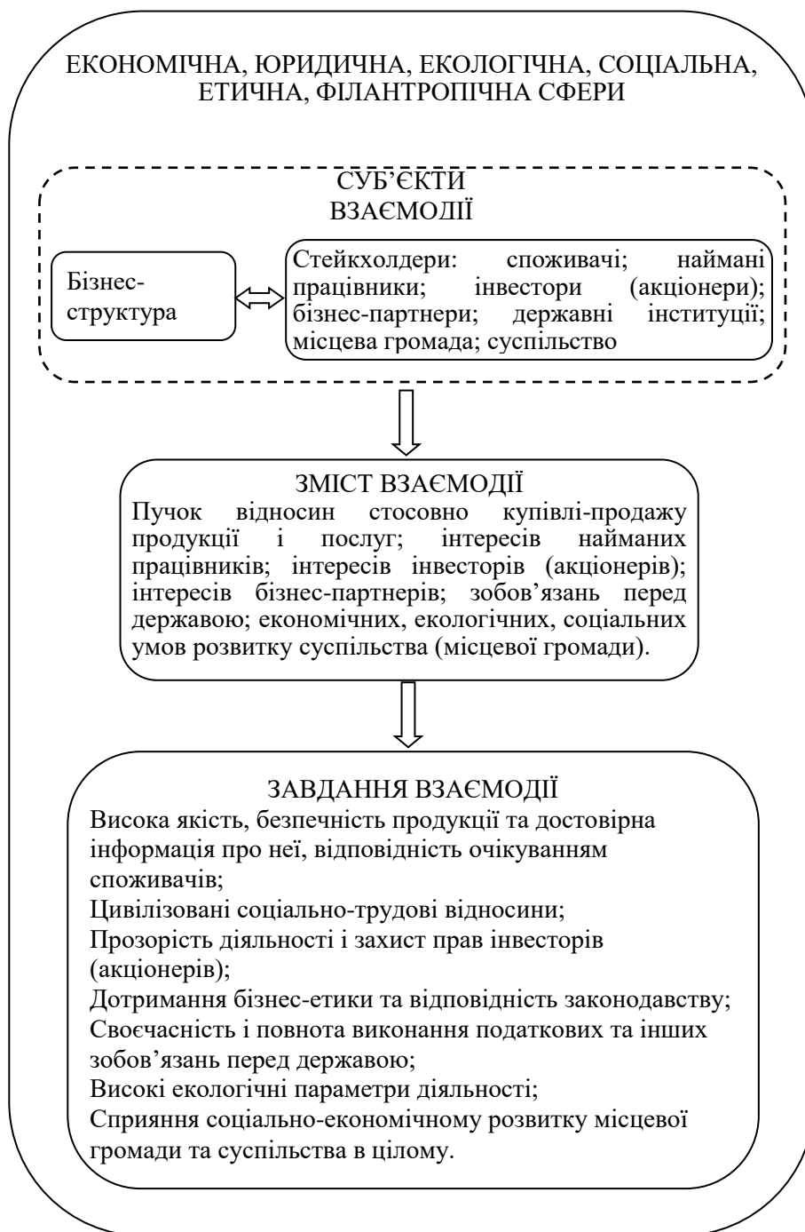
Рис. 1. Структура корпоративної соціальної відповідальності

етичну поведінку, яка сприяє: стійкому розвитку, включаючи здоров'я та благополуччя суспільства; враховує очікування стейкхолдерів; відповідає законодавству й міжнародним нормам; інтегрована у структуру компанії та її поведінку».