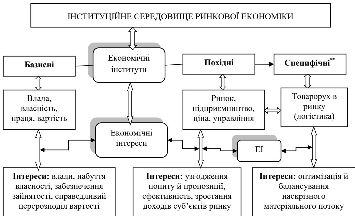
Рис. 3. Інституційна ознака класифікації економічних інтересів суб'єктів ЛЛТР*

* Сформовано авторами з використанням джерел [6, 7, 16];