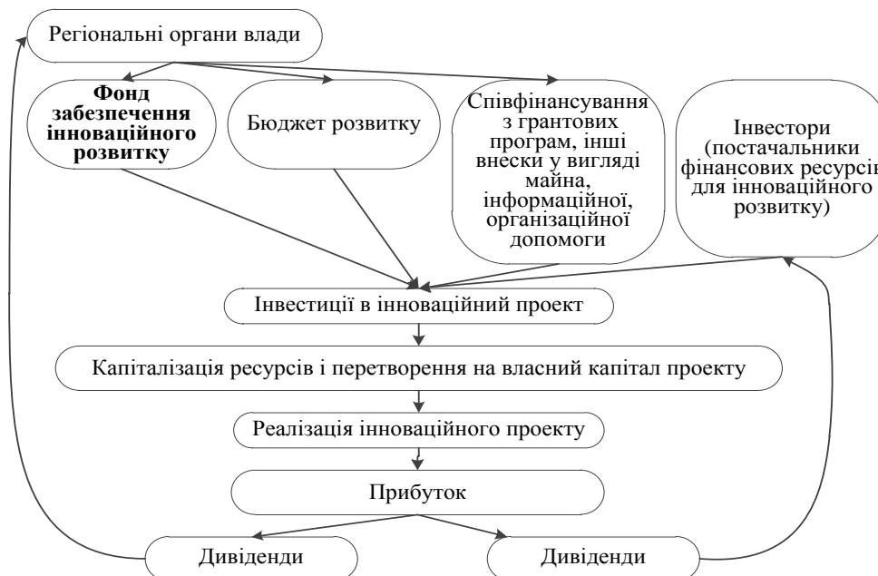
Рис. 2. Механізм фінансової підтримки інноваційного розвитку в регіоні на засадах державно-приватного партнерства за методом участі в капіталі