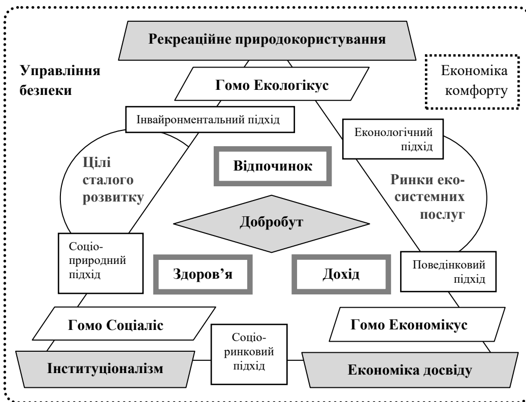
Рис. 2 Взаємозв'язок інклюзивної економіки досвіду та рекреаційного природокористування як концептуальна основа управління оздоровчою рекреацією

В концептуальному інклюзивному підході (рис. 2) охоплено такі три ключові аспекти, що відповідають філософії цього дослідження: економіка досвіду як гносеологічний аспект; рекреаційне природокористування – онтологічний аспект; інституціоналізм як основа методології (що з антропоцентричних позицій можна представити як взаємозв'язок «гомо економікус – гомо екологікус – гомо соціаліс» [12; 33]). Третій аспект означає не тільки і не стільки вагомість управління в складі концепції інклюзивної економіки вражень у природокористуванні, а відповідь на питання «яким чином, за допомогою яких методів і досліджувати, і впливати на предмет дослідження – навколишнє середовище, відображене в екологічній свідомості та поведінці агентів». Реальність такого впливу залежить від того, чи вдалося побудувати інклюзивні економічні, політичні та соціальні інститути.