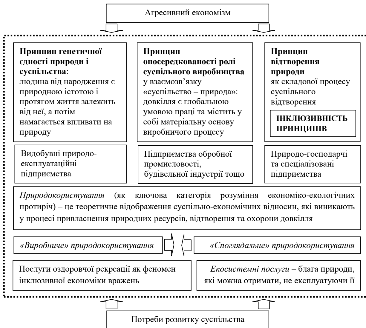
Рис. 1. Інклюзивність методологічних принципів природокористування як основа екологічно орієнтованого управління оздоровчою рекреацією

опосередковано пов'язані з їх економічною діяльністю. Регулювання цих відносин – це прерогатива держави, оскільки еколого-економічні транзакції стосуються природних ресурсів, які знаходяться в державній власності, а також спричиняють зовнішні ефекти, що впливають на третіх осіб.