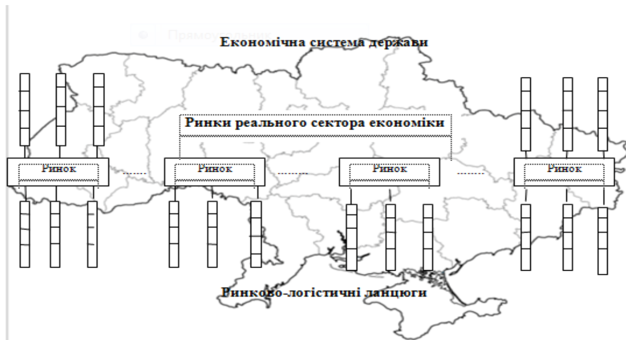
Рис. 2 Логістична структура національно-економічної системи

Структура національної економіки і структура логістики ринків мають бути тісно пов'язані між собою. В такому плані структура національної економіки складається з безліч ринків, які, в свою чергу складаються з безлічі логістичних ланцюгів, а останні - поділяються на логістичні ланки (рис.2).