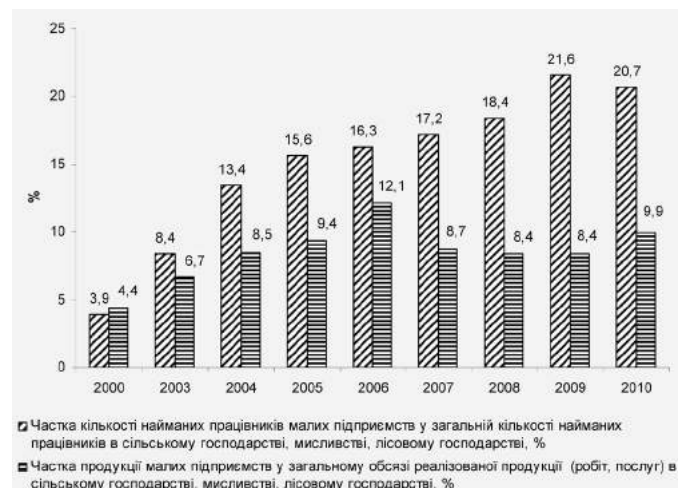
Рис. 3. Динаміка частки продукції малих підприємств у сільському господарстві, мисливстві та лісовому господарстві в загальному обсязі продукції регіону протягом 2000-2010 років (за даними Головного управління статистики в Рівненській області)

Важливою складовою трансформації природно-ресурсної сфери є впровадження елементів екологічного менеджменту в управлінську діяльність виробничо-господарських структур, що значною мірою сприятиме підвищенню