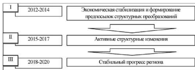
Рис. 3. Ожидаемые темы прироста целевых индикаторов в Одесской области в 2020 году