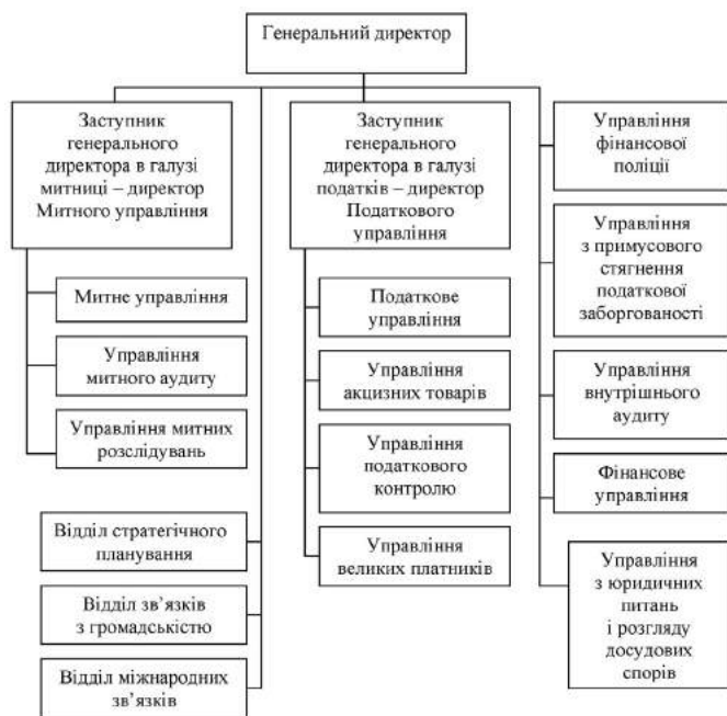
Рис. 2. Структура Служби державних доходів Латвії [5]

У Латвії митне управління входить до складу Служби державних доходів, яка перебуває в структурі Міністерства фінансів (рис. 2).