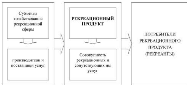
Рис. 2. Коммерческая цепь на рынке рекреационных услуг

риторий способствует наращиванию соответствующего потенциала, активизации рынка рекреационных услуг, который занимает особое место в социально-экономическом развитии регионов и страны в целом.