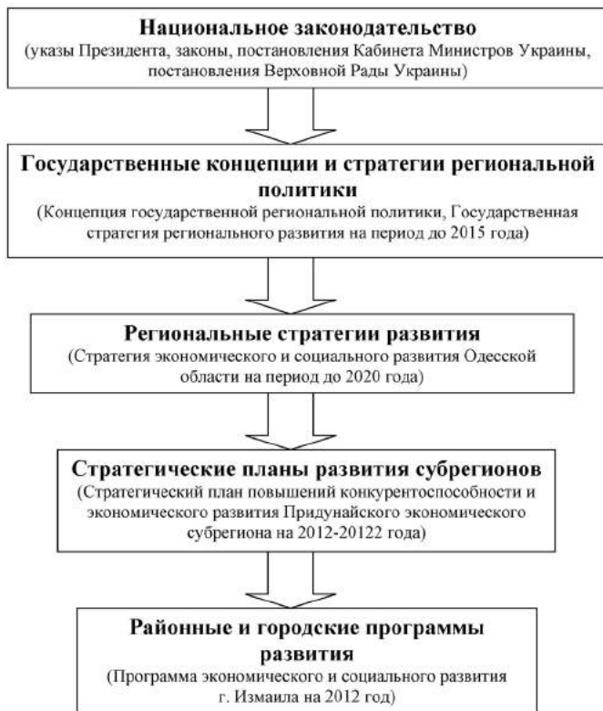
Рис. 3. Система законодательного обеспечения социально-экономического развития регионов Украины

неприбыльные объединения, созданные органами местного самоуправления с целью более эффективного осуществления своих полномочий, согласования действий органов местного самоуправления по защите прав и интересов территориальных общин, содействия местному и региональному развитию.