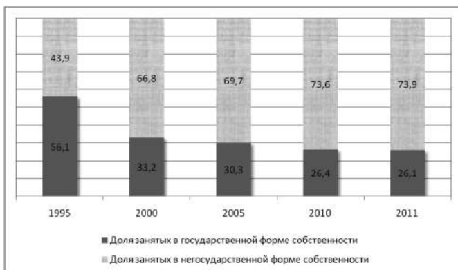
Рис. 3. Доля занятых в государственном и негосударственном секторах экономики Азербайджана, % [6]

По состоянию на начало 2012 года из более чем 8641,5 тыс. га земельного фонда Азербайджана 56,9%, или 4913,6 тыс. га, остались в государственной собственности, 23,5%, или 2032,7 тыс. га, были переданы в муниципальную собственность, а 19,6%, или 1695,1 тыс. га, – приватизированы. На начало 2012 года 871,2 тыс. семей из 873,6 тыс., которым должны были выдать земельные участки, их получили, что составляет 99,7% от обладающих правом получения доли от земель, подлежащих приватизации. Около 1393,3 тыс. га, или 99,8% земель, находившихся в пользовании бывших совхозов, колхозов и других сельскохозяйственных предприятий и предназначенных для приватизации, были переданы в частную собственность.