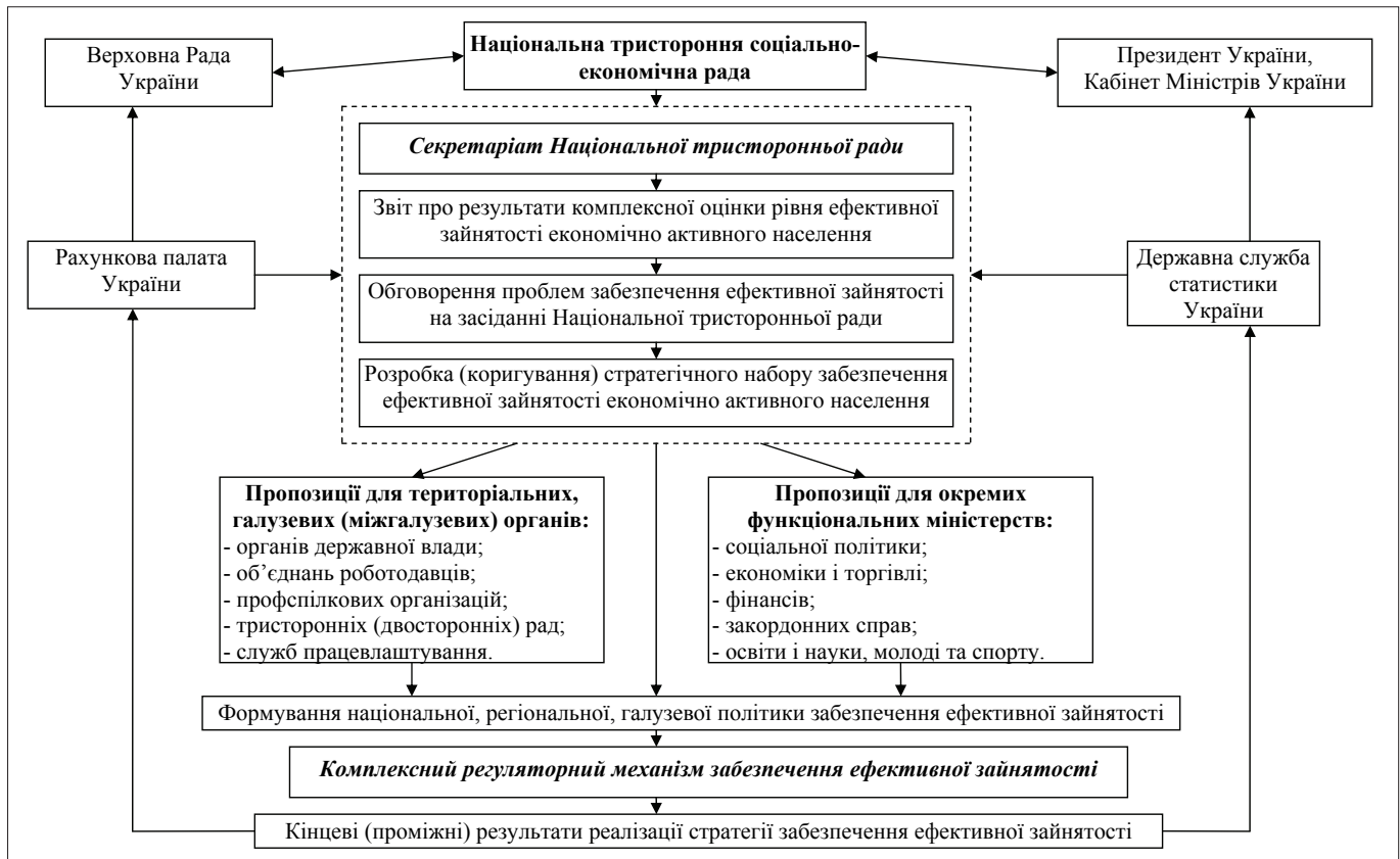
Рис. 1. Порядок розробки та реалізації стратегії забезпечення ефективної зайнятості економічно активного населення

державної політики зайнятості населення в Україні, адже тільки в такому випадку можна сподіватися на підвищення ефективності використання трудового потенціалу.