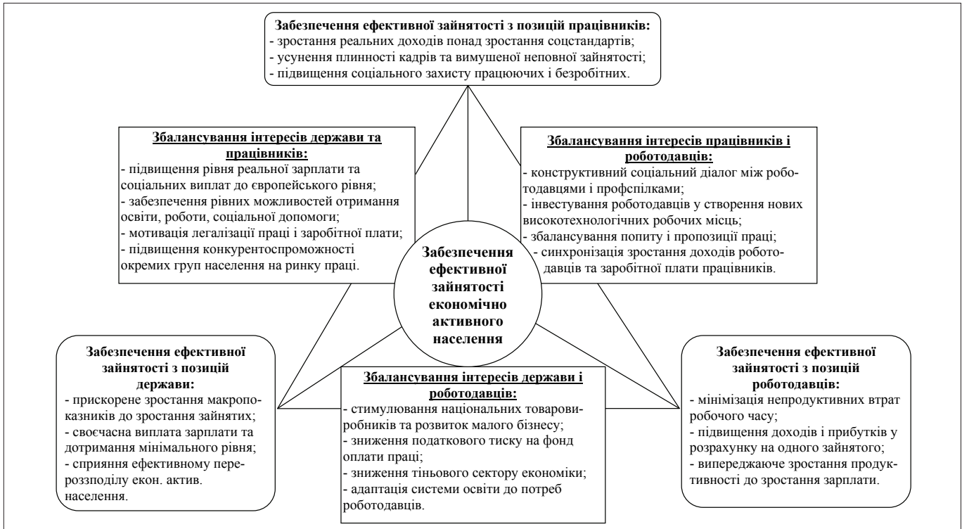
Рис. 2. Стратегічні цілі та завдання забезпечення ефективної зайнятості економічно активного населення

міністерств: соціальної політики, економічного розвитку й торгівлі, фінансів, закордонних справ, освіти і науки, молоді та спорту. Ці суб'єкти разом із Національною тристоронньою соціально-економічною радою формуватимуть засади національної, регіональної та галузевої політики забезпечення ефективної зайнятості.