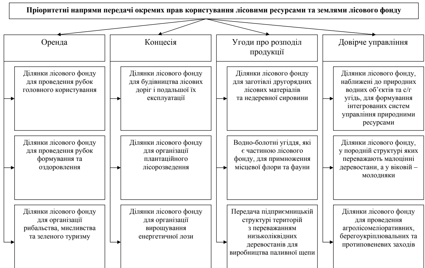
Рис. 1. Пріоритетні напрями передачі окремих прав користування лісовими ресурсами та землями лісового фонду

Прикметними рисами тимчасового користування лісами є такі: множинність та диференційованість, коли одна й та ж лісова ділянка може одночасно взаємоузгоджено використовуватися для різних потреб з неоднаковими термінами користування; платність тимчасового користування лісами. Підставою довгострокового тимчасового користування лісами є відповідний договір, а короткострокового – спеціальний дозвіл. Використання корисних властивостей лісів може бути тимчасово зупинене в разі високої пожежної небезпеки, незадовільного стану лісів унаслідок ущільнення ґрунту їх відвідувачами, виникнення вогнищ шкідників і хвороб лісу та інших факторів, що призводять до послаблення його природних функцій.