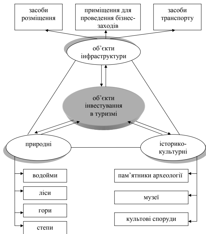
Рис. 1. Об'єкти інвестування в туризмі в розрізі туристично-рекреаційних зон Закарпатської області

«вийдуть із тіньового ринку» та зможуть підвищити прибутки держави, не приховуючи реальної ситуації.