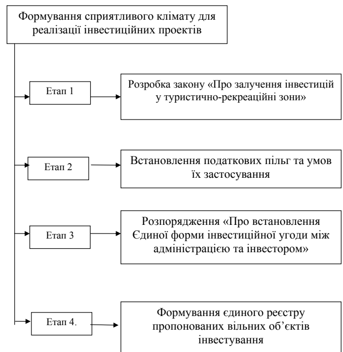
Рис. 2. Схема формування сприятливого клімату для реалізації інвестиційних проектів

пільговий податковий режим і ставка амортизаційних відрахувань, зменшується податок з обороту. В деяких державах пропонуються також митні пільги на ввезення обладнання для готелів і туристичних транспортних засобів [6, с. 356].