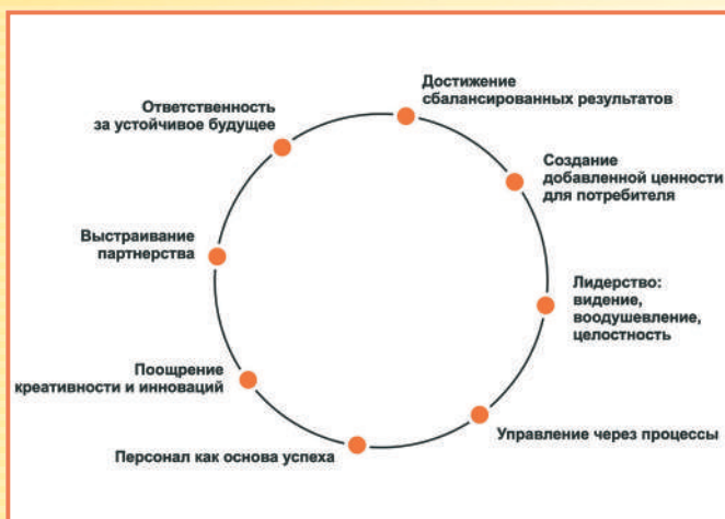
Фундаментальные концепции Совершенства (базовые принципы, лежащие в основе достижения устойчивого совершенства организацией)

Результативность регионального движения за устойчивое развитие подтверждается растущим интересом к Модели EFQM. Ее базовые концепции входят в программы конкурсов по качеству и семинары бизнес-тренеров.