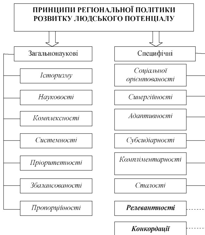
Рис. 1. Система методологічних принципів регіональної політики розвитку людського потенціалу

складової регіональної політики. Дослідження сутності соціального сегменту економічного простору повинні враховувати низку функціональних особливостей соціальної сфери, зокрема її спрямованість на створення сприятливих умов для життєдіяльності населення та формування так званого єдиного соціального простору шляхом зближення рівнів обслуговування жителів окремих територій відповідно до прийнятих у країні соціальних стандартів, а також максимально можливих однакових стартових можливостей для всіх громадян на шляху розвитку їхнього людського потенціалу. Зазначений підхід відповідає таким специфічним принципам регіональної економіки, як соціальної орієнтованості, синергійності, адаптивності, субсидіарності, компліментарності та сталості.