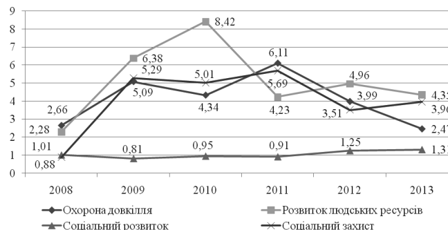
Рис. 3. Динаміка кредитування СБ тематичних напрямів з людського розвитку у 2008-2013 роках, млрд дол. США

Джерело: складено автором на основі [6].