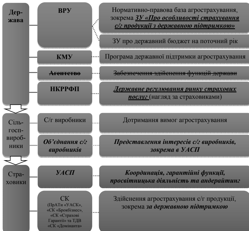
Рис. 2. Трансформаційні зміни в механізмі ДПП страхування аграрних ризиків

Умовні позначення та скорочення: ВРУ – Верховна Рада України; КМУ – Кабінет Міністрів України; НКРРФП – Національна комісія, що здійснює державне регулювання у сфері ринків фінансових послуг; ЗУ – Закон України; с/г – сільськогосподарський; УАСП – Український аграрний страховий пул; СК – страхова компанія; ПРАТІ – приватні акціонерні товариства; ТДВ – товариство з додатковою відповідальністю; жж – видалений елемент в результаті прийняття Закону України «Про особливості страхування сільськогосподарської продукції з державною підтримкою» (далі – Закон) та жжж – елемент, що з'явився в механізмі ДПП в результаті прийняття Закону.