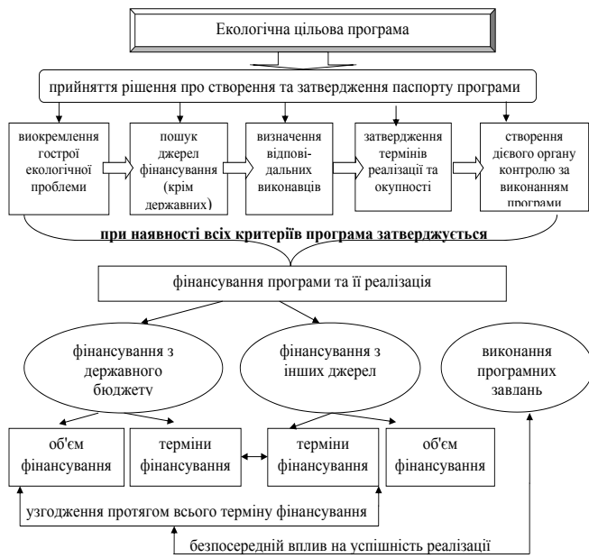
Рис. 1. Дескриптивна модель ефективної реалізації державної екологічної цільової програми