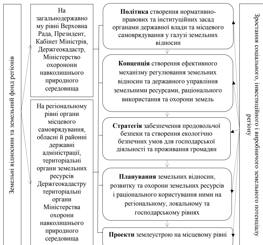
Рисунок. Логічно-смилова схема формування та реалізації регіональної земельної політики