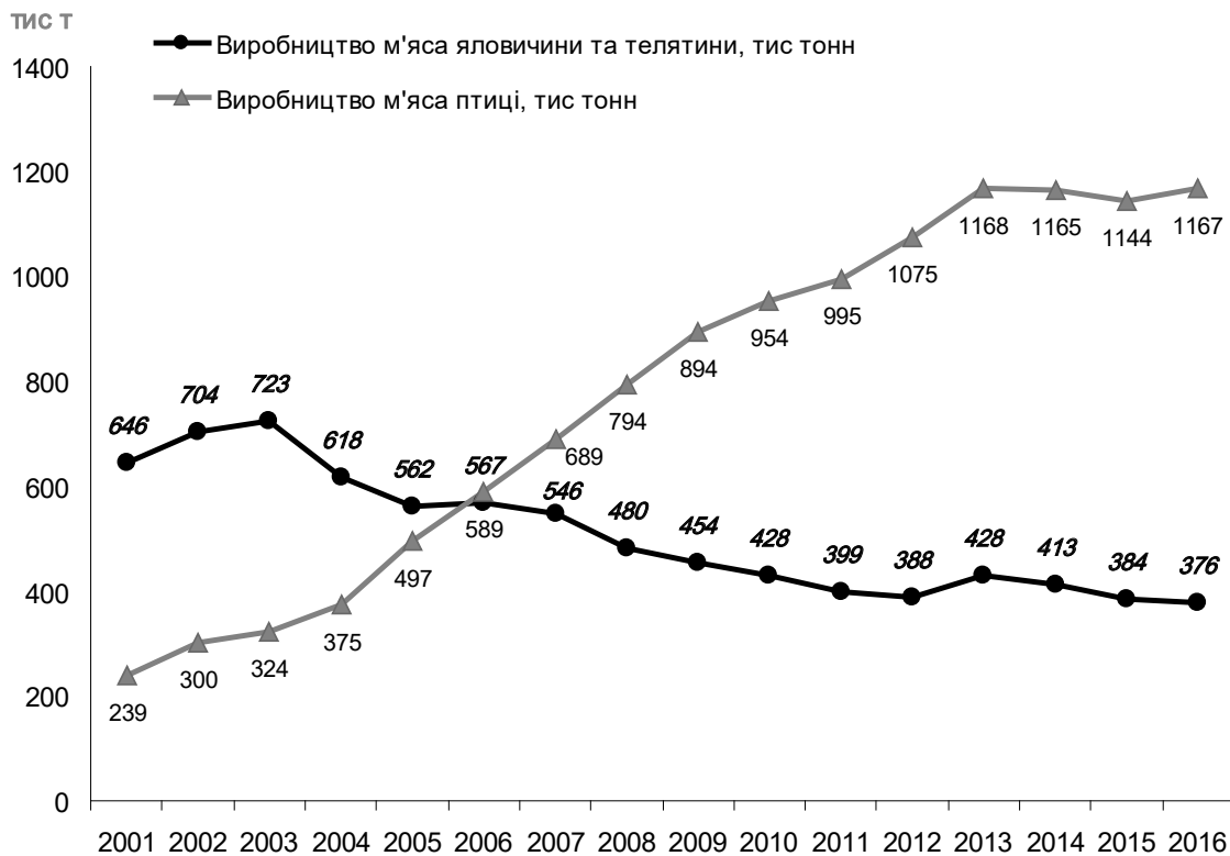
Рис. 4. Динаміка виробництва м'яса яловичини та телятини і м'яса птиці всіма категоріями господарств*

* Розраховано за даними Державної служби статистики України.