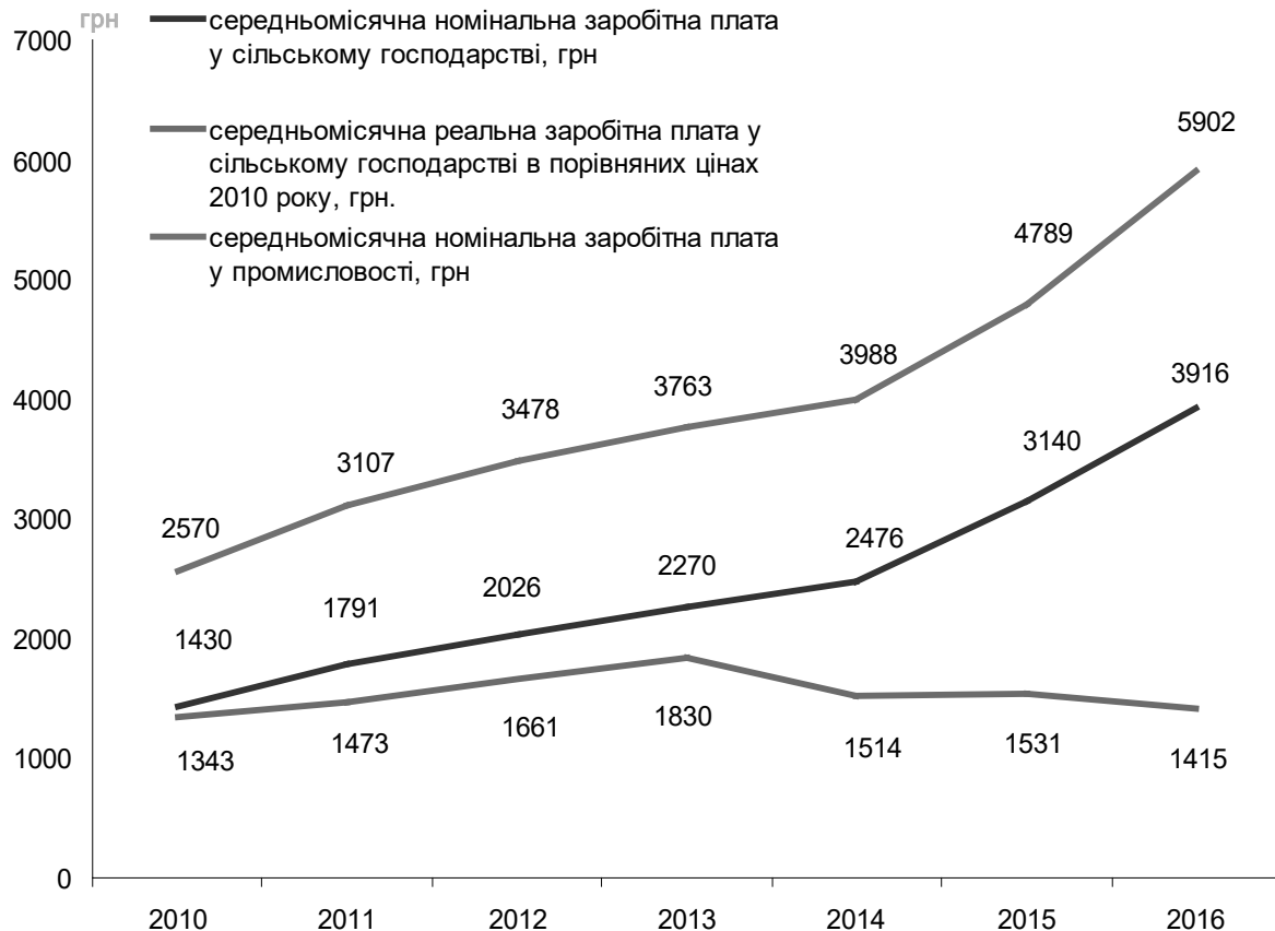
Рис. 2. Заробітна плата в сільському господарстві та промисловості*

Необхідно посилити підтримку фермерських господарств та господарств населення на кооперативній основі як базового інституціонального підґрунтя відновлення втрачених у кризові роки обсягів виробництва тваринницької продукції. Вагомим аргументом у цьому напрямі є позитивна динаміка виробництва продукції тваринництва у фермерських господарствах у 2000-2016 роках навіть за умов відсутності сис-