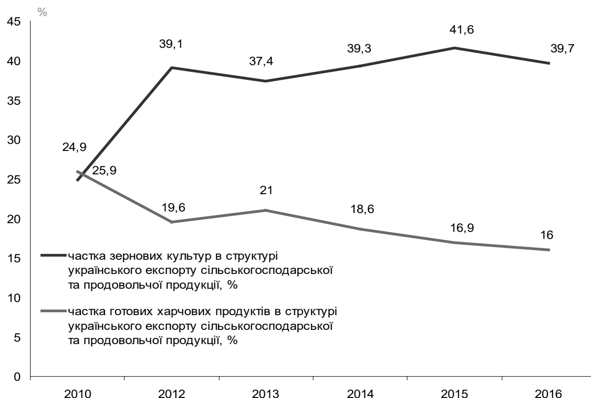
Рис. 5. Частка зернових культур та готових харчових продуктів у структурі українського експорту сільськогосподарської та продовольчої продукції*

* Розраховано за даними Державної служби статистики України.