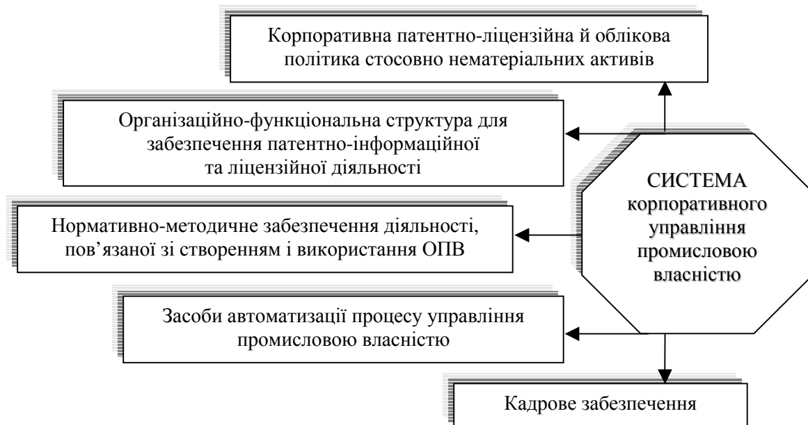
Рис. 2. Система корпоративного управління промисловою власністю [16, 80]

Для порівняння розглянемо управління промисловою власністю запропоновану систему корпоративного О.Д. Святоцького (рис. 2) [16, 80].