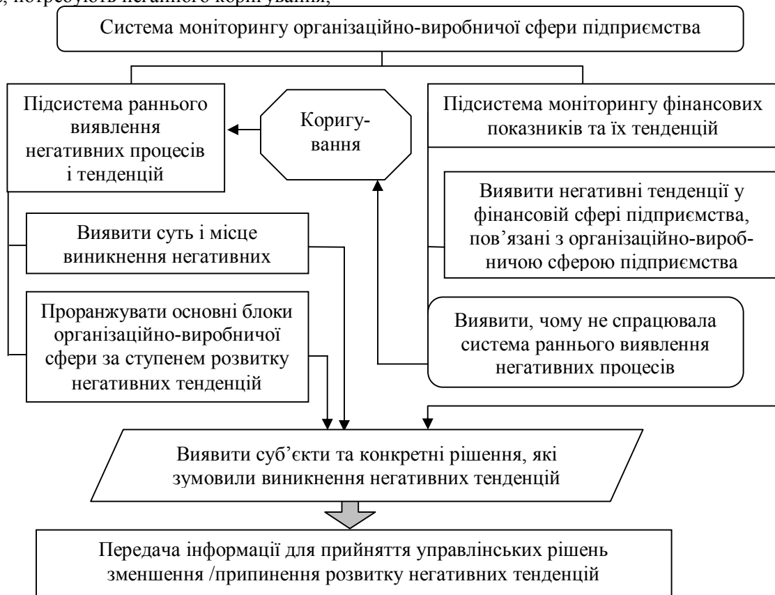
Рис. 2. Основні завдання моніторингу організаційно-виробничої сфери задля попередження банкрутства

менеджменту виявилися неефективними, а отже, потребують негайного коригування;