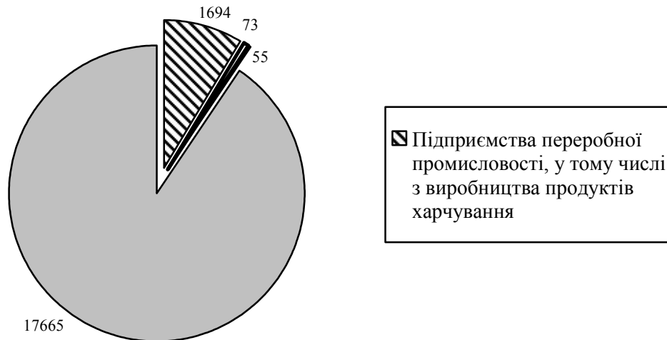
Рис. 1. Частка промислових підприємств у загальній кількості підприємств області

Частка переробних підприємств складає 93% всіх промислових підприємств, яких станом на 01.01.2012 р. налічується 1822 одиниці. З них підприємств добувної промисловості налічується 73 господарючі одиниці, їх частка в загальній кількості промислових підприємств складає всього 4%, решту – 3% (55 суб'єктів господарювання) – займають підприємства з виробництва і розподілення електроенергії, газу, води. Незважаючи на те що кількість підприємств за досліджуваний період зростає, складні економічні умови вимагають у першу чергу підвищення ролі та значення якісних характеристик розвитку сучасних підприємств.