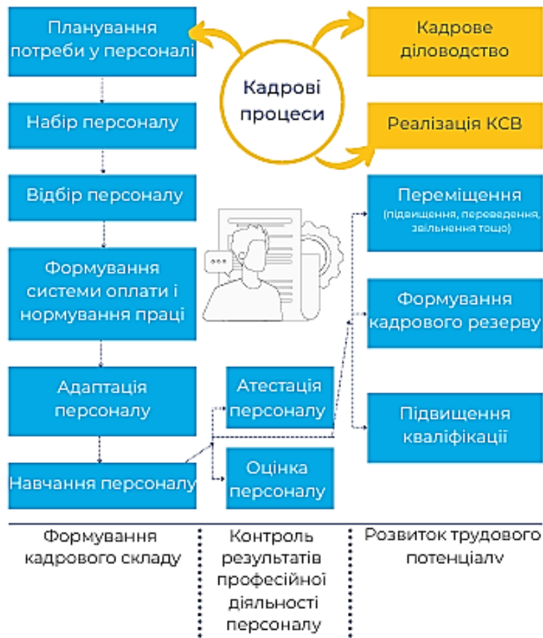
Рисунок 2 – Схема кадрових процесів на підприємстві