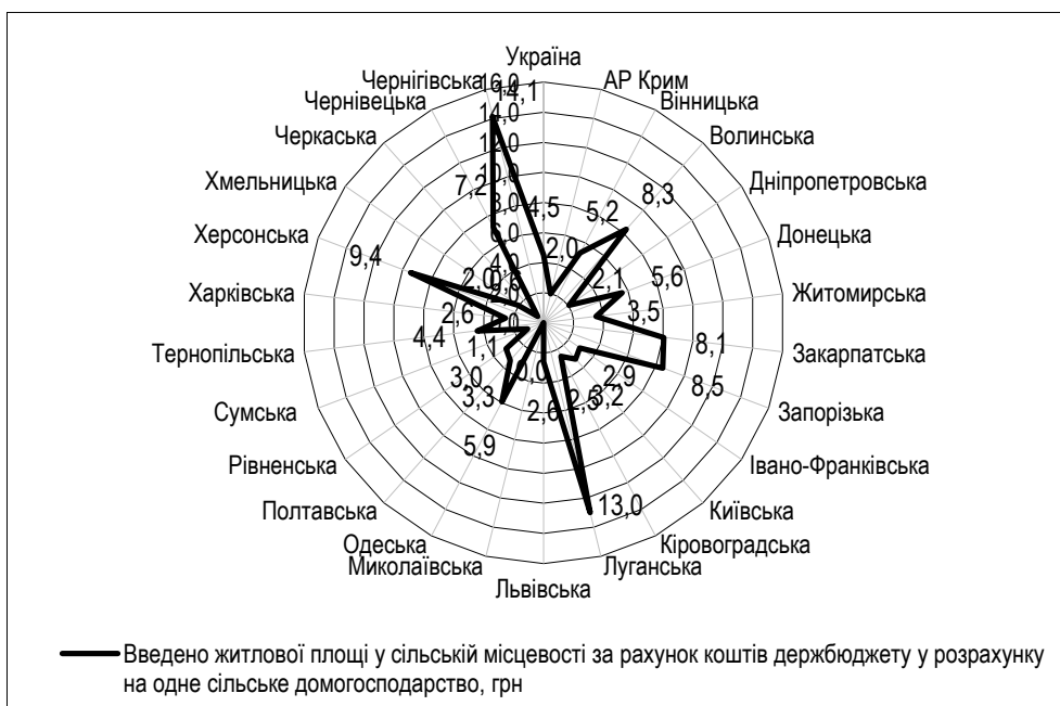
Рис. 3. Надані кошти держбюджету для будівництва житла за програмою "Власний дім" у розрахунку на одне сільське домогосподарство за регіонами, 2012 р., грн

розподілі бюджетних коштів. Останнім часом представники органів влади, зокрема й очільник Міністерства регіонального розвитку, будівництва та житлово-комунального господарства України, вказують на необхідність розподіляти гроші за програмами в регіони за пропорційним принципом [2], більше того – виступають проти концентрації ресурсів на рівні міністерств із їхнім подальшим розподілом серед регіонів за різними програмами. Якщо ж консолідується ресурс для регіонального розвитку, то він має бути у повному обсязі переданий у кожному територіальну громаду [3].