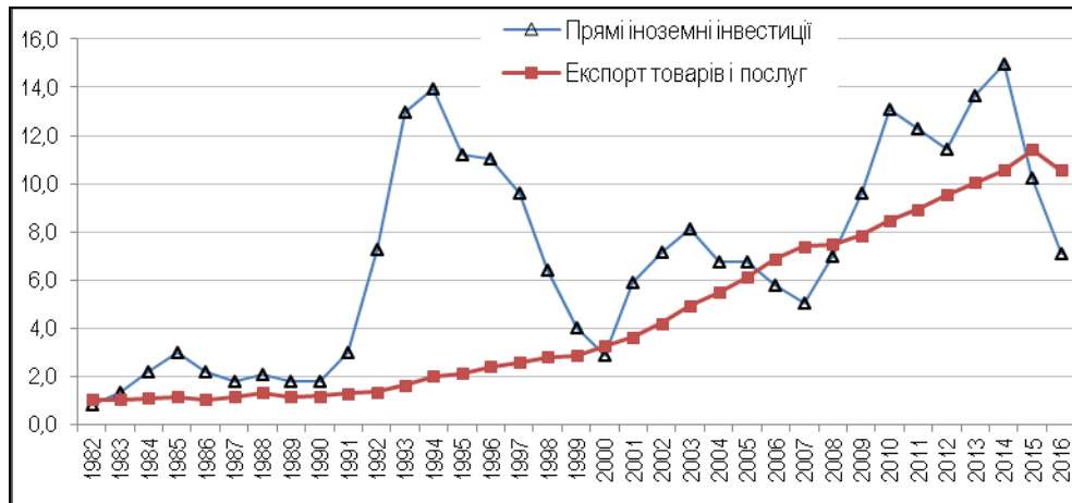
Рис. 2. Частка Китаю у світовому експорті та припливі ПІІ у 1982–2016 рр., %