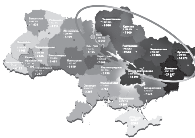
Рис. 4. Сокращение населения Украины по областям с выделенной зоной сокращения количества населения