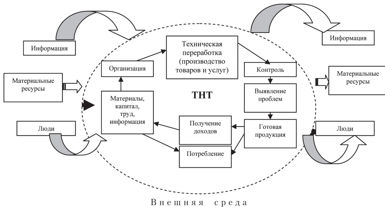
Рис. 5. ТНТ как открытая система

чайно указано между блоками «Контроль» и «Готовая продукция». Внутренняя среда ТНТ предполагает выявление проблем, но при этом условия рыночной экономики не предполагают решение этих вопросов внутри системы (во внутренней среде), а выносят на рассмотрение внешней среде – для их решения на уровне государства или общества в целом. По сути, это – согласование вопросов функционирования ТНТ с государственными приоритетами с учетом важности экономических, социальных, правовых позиций. Однако на такую расстановку приоритетов влияют сотни факторов, которые бывает нелегко сложить в единую картину. А если учесть, что решение принимает не один руководитель и не на одном уровне и каждый имеет свои интересы при ограниченной информации и недостатке времени, то в этом случае высока вероятность принятия ошибочного или малоэффективного решения.