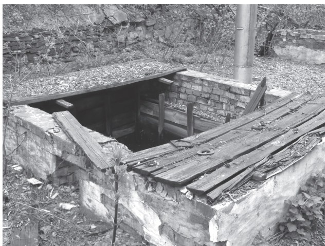
Рис. 1. Люк в подземное хранилище отработанных реактивов, заполненный грунтовыми водами, апрель 2010 г.

Возможности оценивать (и, в определенных пределах, контролировать) влияние на экологическую безопасность некоторых показателей эксплуатации промышленных объектов сохранились только для предприятий государственного сектора экономики. Законом Украины «Об управлении объектами государственной собственности» в числе полномочий центрального органа исполнительной власти, обеспечивающего реализацию государственной политики в сфере управления объектами государственной собственности, предусмотрена его обязанность способствовать, в пределах его полномочий, модернизации предприятий государственного сектора экономики, относящихся к сфере его управления, улучшению их энергоэффективности и экологических показателей (п. 23 ч. 1 ст. 5–1) [11]. При этом уполномоченные органы управления обязаны обеспечивать проведение экологического аудита государственных предприятий, хозяйственных структур, в том числе передаваемых в аренду (п. 26 ч. 1 ст. 6), а Фонд государственного имущества Украины уполномочен обеспечивать прове-