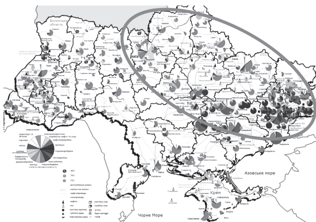
Рис. 3. Карта промышленности Украины с выделенной зоной ТНТ

Количество украинцев за годы независимости сократилось с 52 до 45,5 миллионов человек. Ежегодно население Украины сокращается на 500 тыс. человек [10]. По данным Государственной службы статистики, на 1 мая 2013 г. численность населения Украины составила 45 млн 495 тыс., а уже на 1 июня – 45 млн 480 тыс. [14]. Как отмечают эксперты, ухудшаются показатели не только количества, но и качества населения: здоровье, уровень образования, степень активности жизненной позиции и удовлетворенности жизнью. Демографические показатели обусловлены также неблагоприятной экологической ситуацией, тяжелыми условиями работы, что негативно сказывается на здоровье и продолжительности жизни [10].