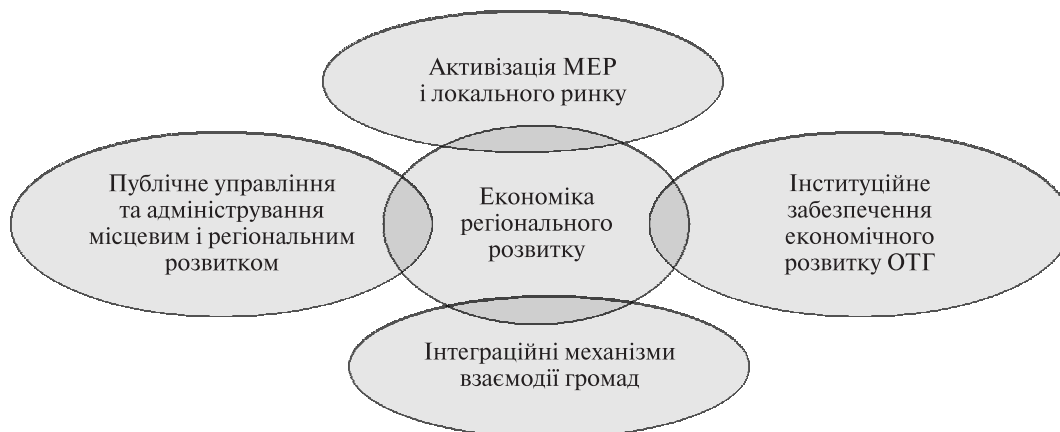
Вплив ОТГ на розвиток економіки регіонального простору

1. У межах освоєння місцевого економічного простору і активізації локального ринку: