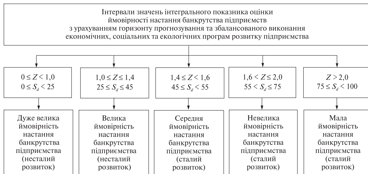
Рис. 1. Шкала визначення ймовірності настання банкрутства підприємств з урахуванням горизонту прогнозування та збалансованого виконання економічних, соціальних та екологічних програм розвитку підприємства (розроблено авторами)

На підставі даних фінансової звітності підприємств-банкрутів за два роки до початку процедури їхнього банкрутства та даних останніх двох років підприємств не банкрутів із застосуванням дискримінантного аналізу побудовано чотирьохфакторне лінійне рівняння (2), яке дає змогу оцінити ймовірність настання банкрутства підприємств протягом двох років, тобто у середньостроковому горизонті прогнозування ( Z_2 ):