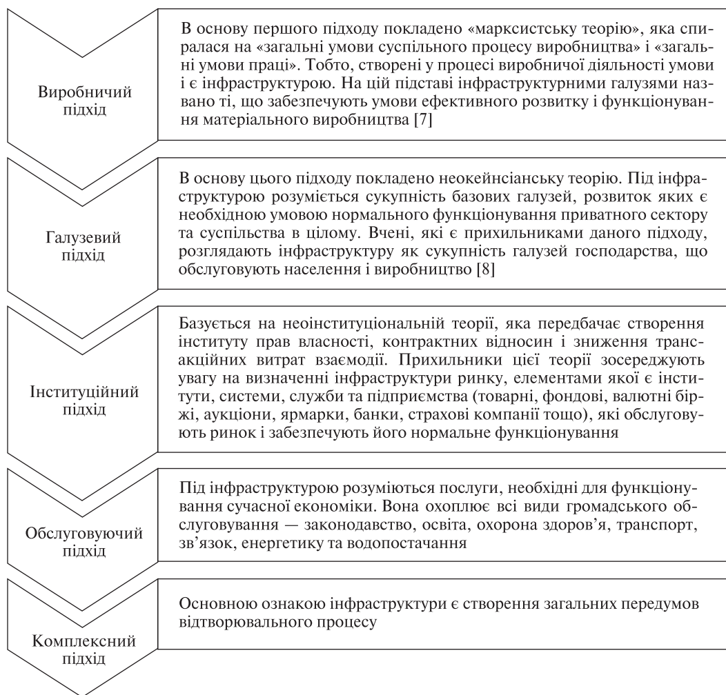
Рис. 2. Характеристика методологічних підходів до визначення сутності поняття «інфраструктура»

Елементи соціальної інфраструктури складають матеріально-технічну основу освіти, охорони здоров'я, занять спортом, культури, побутового обслуговування та роздрібної торгівлі,