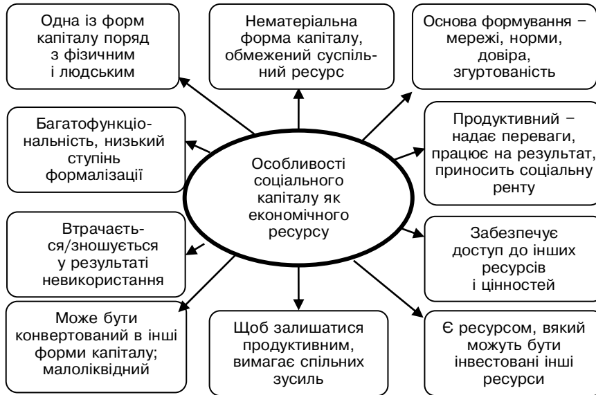
Рисунок 1. Характеристика соціального капіталу як економічного ресурсу

лишатися продуктивним, СК вимагає спільних зусиль декількох сторін (учасників бізнес-проекту, мережі постачальників