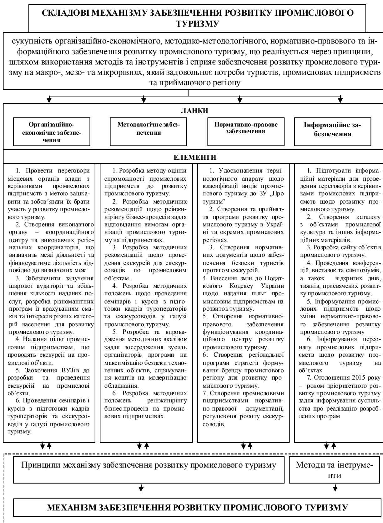
Рис. 2. Напрямки удосконалення механізму забезпечення розвитку промислового туризму