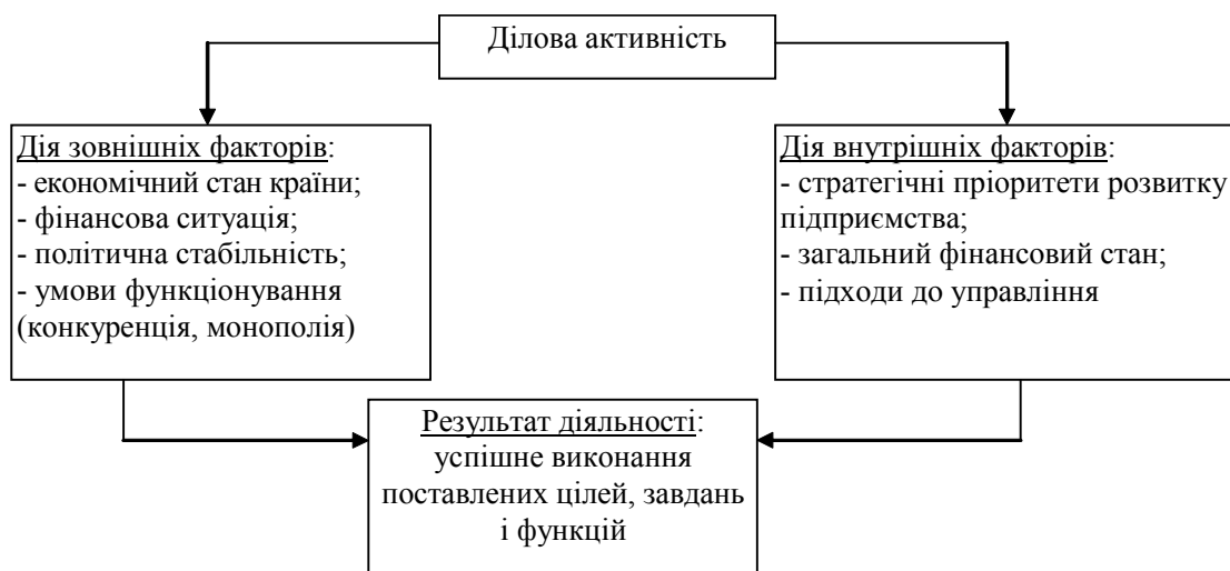
Рис. 1. Основні фактори, що впливають на ділову активність промислових підприємств