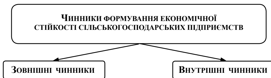
Рис. 2. Чинники формування економічної стійкості сільськогосподарських підприємств

продуктивності праці [1], адже фінансова стійкість – коефіцієнт поточної ліквідності, коефіцієнт фінансової стійкості, коефіцієнт покриття тощо.