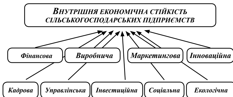
Рис. 3. Складові внутрішньої економічної стійкості сільськогосподарських підприємств