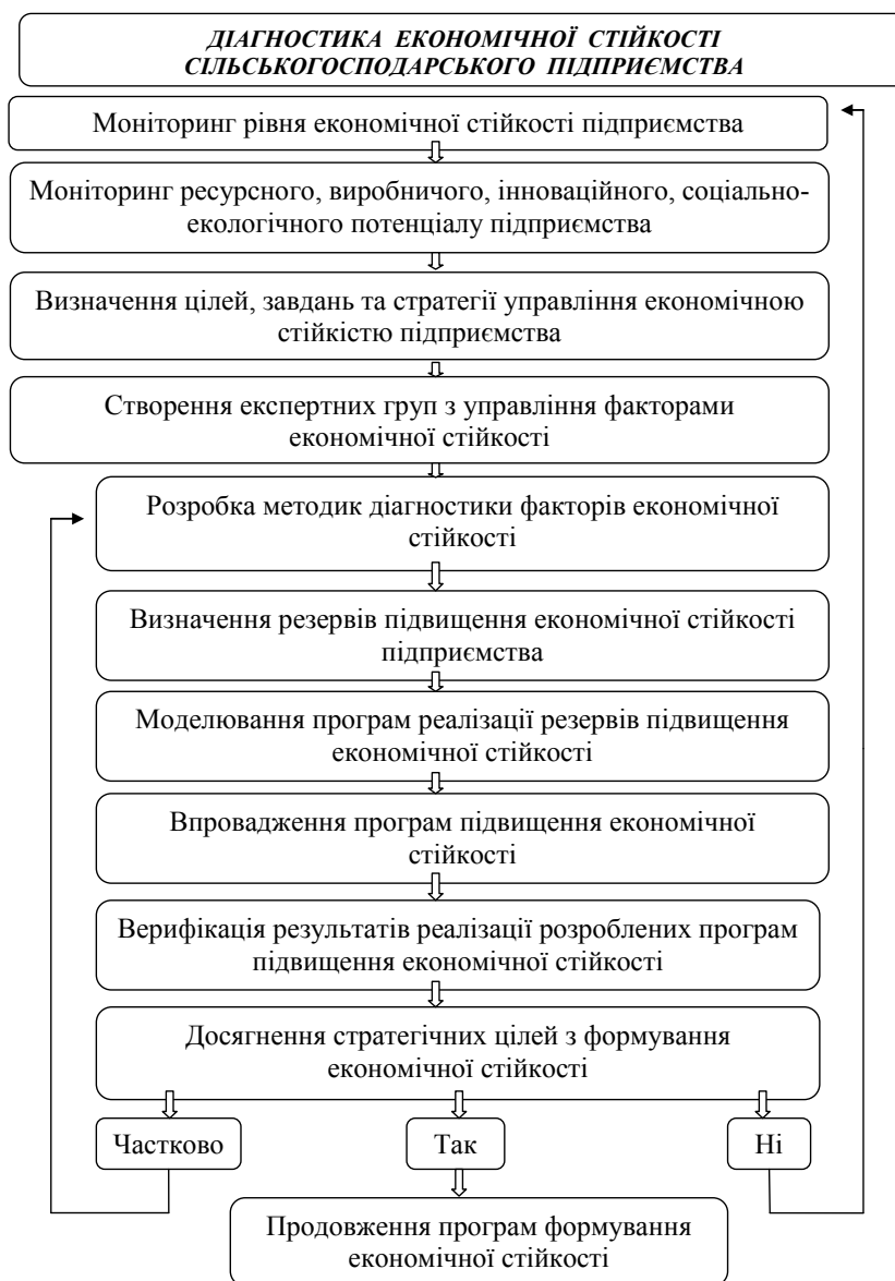
Рис. 4. Діагностика економічної стійкості сільськогосподарських підприємств

ставлених завдань, приймати ризикові і нестандартні рішення у випадку відхилення розвитку ситуації від допустимого ходу подій, координувати дії всіх учасників і постійно контролювати хід виконання заходів та їхні результати.