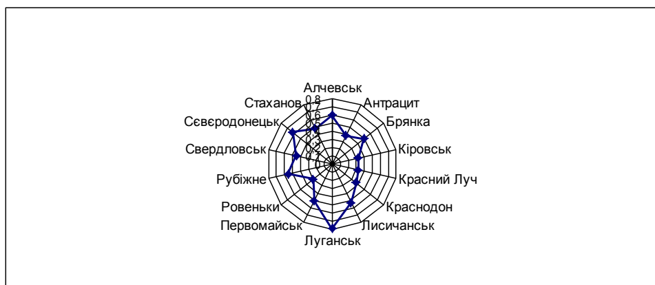
Рис. 1. Розподіл міст Луганської області за інтегральним показником розвитку малого підприємництва у 2011 р.

Для більш повної характеристики рівня розвитку малого бізнесу регіону, проведемо його оцінку за вида-