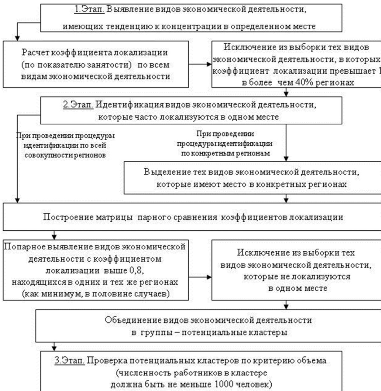
Рис. 1. Алгоритм идентификации потенциальных кластеров в регионе

Тенденция к концентрации имеет место в том случае, когда доля регионов с коэффициентом локализации больше 1 не превышает 40% от общего числа.