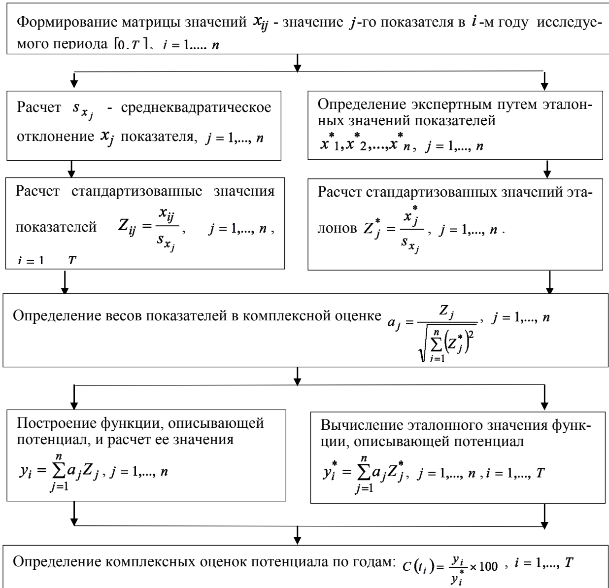
Рис. 1. Алгоритм расчета комплексной оценки потенциала организации