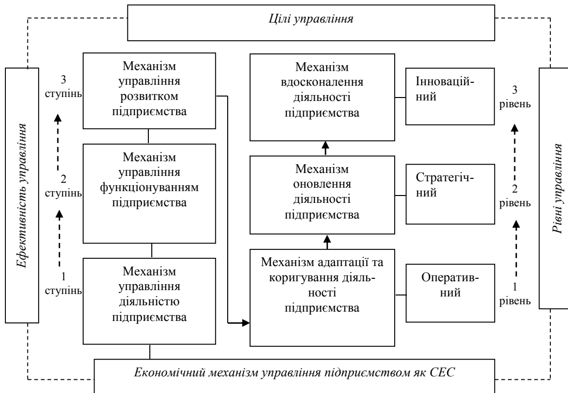
Рис. 1. Місце механізму управління розвитком підприємства в економічному механізмі управління підприємством і його еволюційні форми

Формування цільової функції є складним процесом, що пов'язаний із виробленням стратегічних напрямків соціально-економічного розвитку, прийняттям відповідних рішень і виробленням механізму їх реалізації. Накреслюючи цільові функції, держава бере на себе не тільки те, що непідвладне ринковій системі. Найважливішим напрямом реалізації цільової функції є визначення пріоритетів економічного розвитку підприємства. Саме вона визначає (задає) вектор розвитку підприємства як системи.