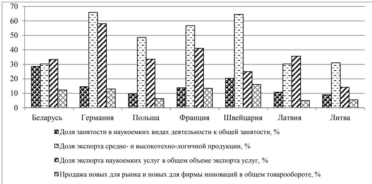
Рис. 2. Сравнительные показатели некоторых стран по данным «Innovation Union Scoreboard 2015»

ниже, чем занятых. Из них 18,2% работает в образовании и здравоохранении, инновационность конечного продукта которых в Беларуси не оценивается, а персонал не разделен на группы ординарной и наукоемкой работы. К этому следует добавить уровень изношенности основных средств в каждом из этих видов деятельности (около 35%), степень их обновления – 2,1% в год в образовании и 3,5% – в здравоохранении, то скептическое отношение к представленному уровню анализируемого показателя возрастает.