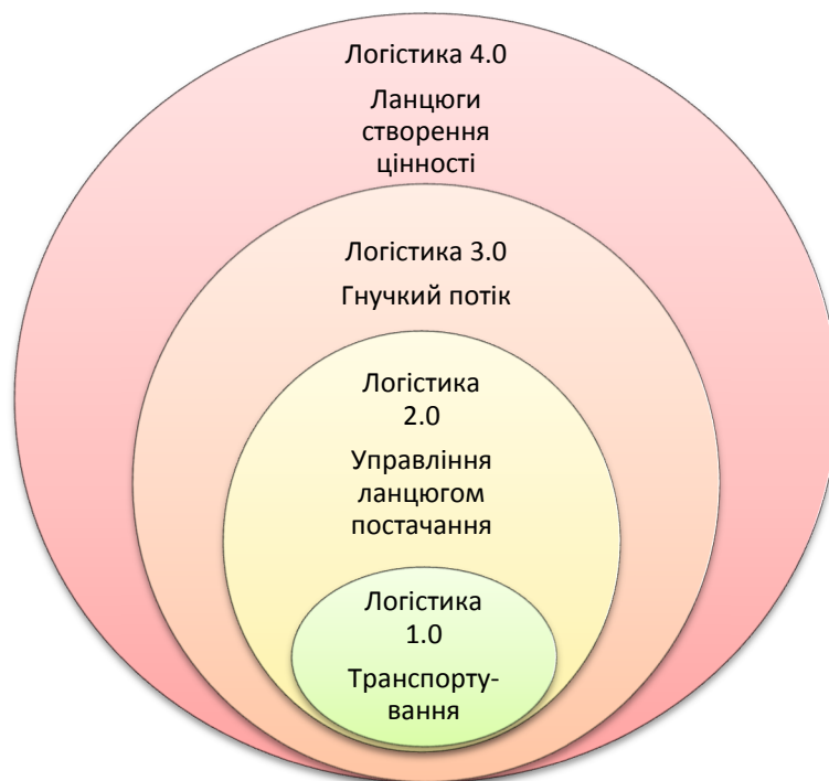
Рис. 2. Взаємозв'язок ер логістики

З іншого боку, Логістика 4.0 була визначена як термін, що включає технології та концепції в ланцюжку створення вартості організації [33] починаючи з постачальників і закінчуючи кінцевим користувачем, з метою максимізації цінності доставленої продукції. Можна зазначити, що фокус перспективи ланцюга створення вартості пов'язано з охопленням потреб кінцевих користувачів і клієнтів, а не лише з прогнозуванням вимог ринку. Логістика 4.0 підвищує рівень гнучкості логістики для задоволення ринкового попиту, що сильно коливається. Це збільшення гнучкості робить клієнта ближче до компанії, що, у свою чергу, покращить можливості оптимізації виробництва. Збільшення зниження витрат на зберігання та виробництво призводить до досягнення кращого рівня задоволеності споживачів (рис. 2).