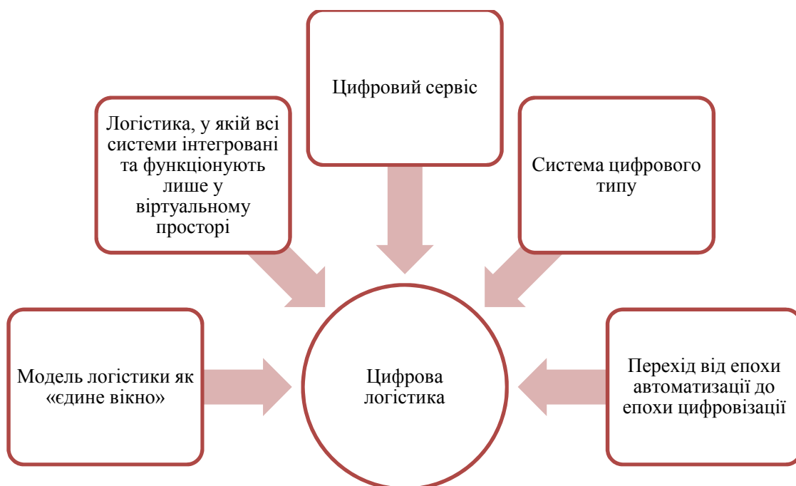
Рис. 4. Ключові складові поняття цифрова логістика

гії, що забезпечують виявлення та прогнозування потреб, оптимізації маршрутів, напрямів матеріальних та інформаційних потоків, у тому числі скорочення часу існування в ланцюгах поставок [36].