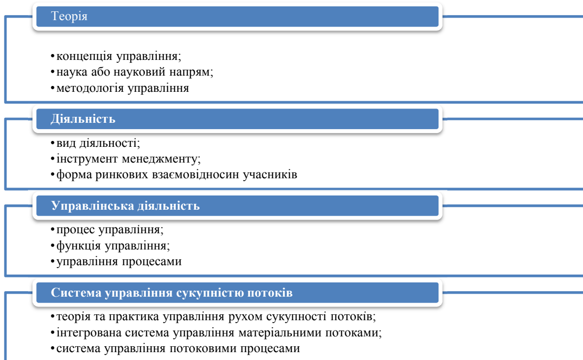
Рис. 3. Систематизація існуючих визначень поняття «логістика»

Побудовано автором на основі джерела [25].