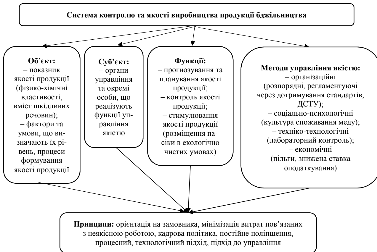
Рис. 2. Система контролю та якості виробництва продукції бджільництва