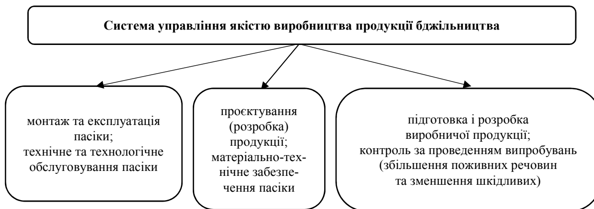
Рис. 3. Система управління якістю виробництва продукції бджільництва

Систему забезпечення та управління якістю за виробництвом продукції бджільництва можна представити у вигляді схеми (рис. 3).