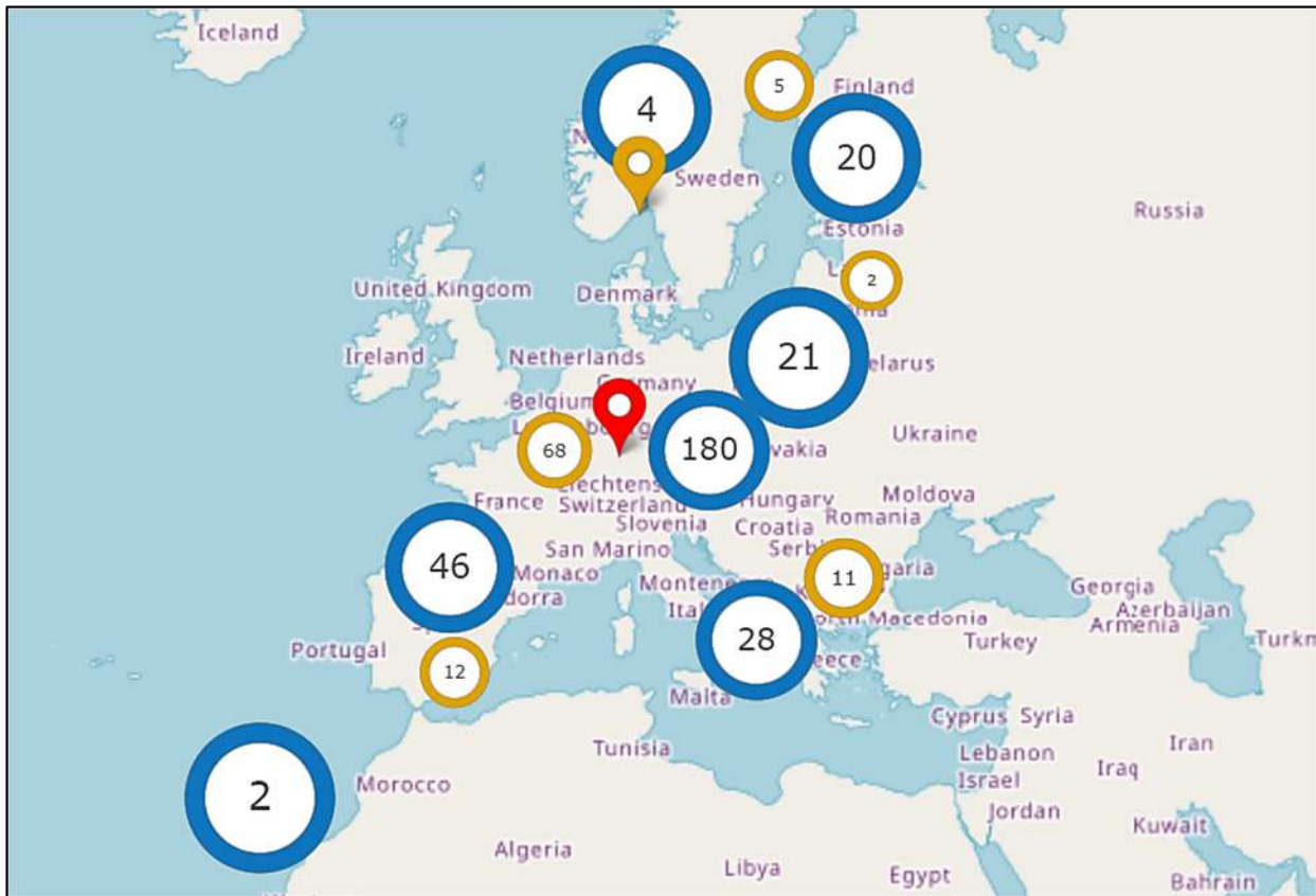
Рис. 2. Центри цифрових інновацій для промисловості на Платформі смарт-спеціалізації (RI3S), 2022 р. [57]